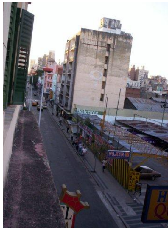
Stadtviertel in Córdoba

Für einen Aufenthalt von vier Wochen berechnen wir 690,- Euro, für fünf Wochen 780,- Euro, für sechs Wochen 870,- Euro. Sollte ein längerer Zeitraum gebucht werden (z.B. zwei Monate und länger), so setzt sich der Preis folgendermaßen zusammen: für vier Wochen werden 690,- Euro veranschlagt, für jeden weiteren vollen Monat 300,- Euro, pro zusätzliche Woche 90,- Euro.