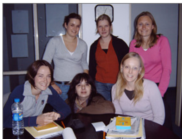
Teilnehmerinnen bei einem Spanischkurs in Córdoba

ist zum Erlernen, Auffrischen und Vertiefen der Spanischkenntnisse empfehlenswert. Zudem dient er der Vorbereitung auf das Projekt. Er kann als Begleitkurs zum Praktikum oder auch als vorgeschalteter Intensivkurs auf Wunsch besucht werden. Wer einen Sprachkurs wünscht, kann ihn als Einzelunterricht von jeweils 20 Stunden für 150,- Euro buchen. Falls der Wunsch an einem Sprachkurs besteht, bitte bei der Anmeldung vermerken. Die Kursleiter/innen sind als Sprachlehrer/innen tätig und haben gute Erfahrung im Sprachenunterricht.