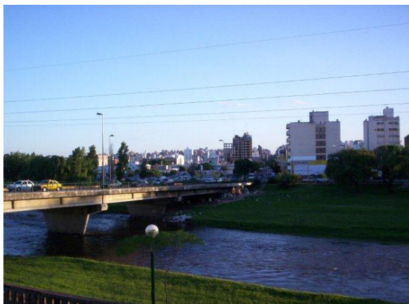
Córdoba, Stadtteil Alta Córdoba

Bei Abmeldung berechnen wir 300,- Euro Stornierungsgebühr. Die Kosten, die für die Stornierung des Flugtickets anfallen, müssen ebenfalls von euch übernommen werden und fallen je nach Fluggesellschaft unterschiedlich aus.