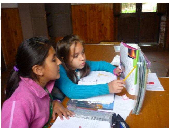
Lernende Mädchen im Wohnheim

las niñas han sido apartadas momentáneamente de sus familias biológicas, por problemas de violencia familiar. El hogar consta con un apoyo constante de psicólogos, psicopedagogos y otros profesionales para su bienestar afectivo. Trabaja con asistentes sociales que visitan a las familias biológicas o sustitutas.