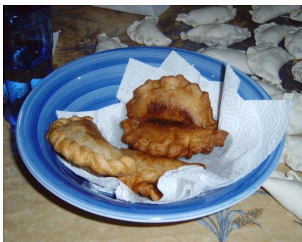
Empanadas, zubereitet von Teilnehmern

findet am gleichen Termin wie das Vorbereitungsseminar für die Argentiniergruppe in Frankfurt statt. Dieses wird zwei Mal im Jahr durchgeführt, im Frühjahr zwischen Ende Februar und Anfang März und im Spätsommer etwa Ende August. Die aktuellen Termine könnt ihr gerne bei der Programmleitung erfragen. Auf dem Vorbereitungsseminar erhaltet ihr hilfreiche Informationen für den Aufenthalt in Argentinien. Dazu gehören organisatorische Hinweise zu verschiedenen Aspekten des Programms sowie allgemeine Informationen über Stadt, Land und Leute, wodurch wir einen Beitrag dazu leisten möchten, dass ihr Argentinien besser verstehen werdet. Außerdem gibt es die Möglichkeit, eigene Themen einzubringen und die Fragen zu klären, die euch vor der Abreise beschäftigen. Neben dem landeskundlichen Teil dient das Treffen auch der methodischen Vorbereitung. Die Übernachtung und Verpflegung im Haus der Jugend sind im Preis inbegriffen.