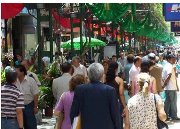
Córdoba, Fußgängerzone in der Innenstadt

Sehr wichtig: Euer Reisepass muss mindestens 6 Monate über das Ende der Reise hinaus gültig sein!